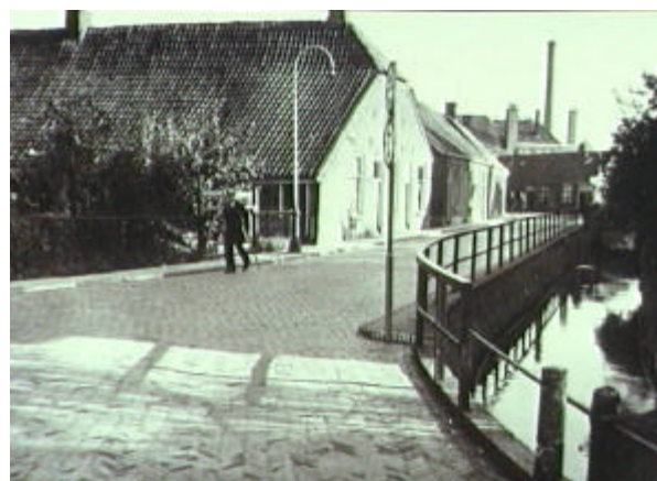
Het “Boerrigtersshoes”, adres Beekstraat nr. 5, ca. 1950.