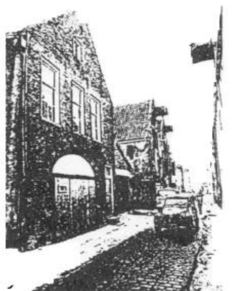
Het huis van de familie Luttmer in Groningen